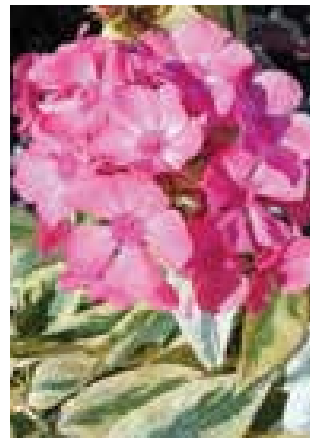
Phlox p. 'Becky Towe'