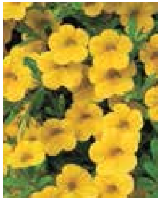
Calibrachoa 'MB Neon Yellow'