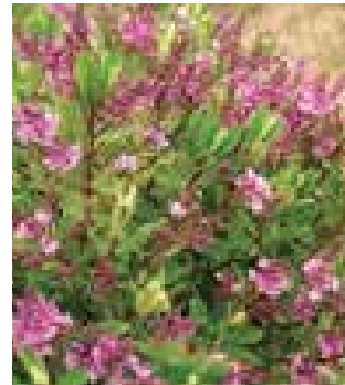
Hebe 'Pink Fantasy'