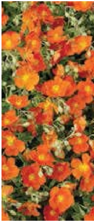
Helianthemum 'Henfield Brilliant'