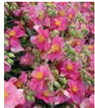
Helianthemum 'Raspberry Ripple'