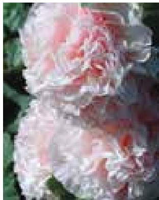
Alcea r. 'Chater's Double Apricot'