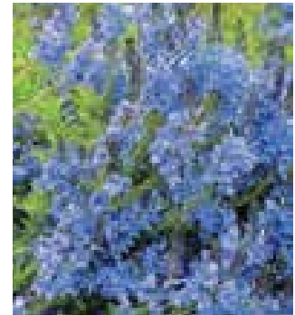
Veronica 'Crater Lake'