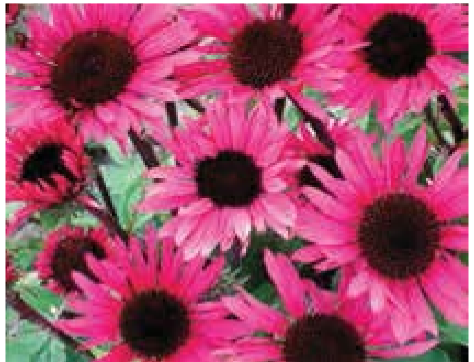
Echinacea 'Fatal Attraction'